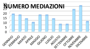
TOTALI VALORI DELLE LITI

*Numero mediazioni pervenute ai sensi del D.Lgs 28/2010